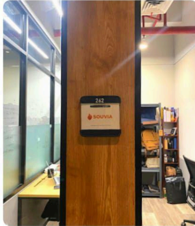
Jakarta Sales Office (2023)