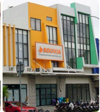
New Bogor Office (2024)

[19:41, 10/2/2024] +62 812-8219-4914: Ngejreng banget ya 😊